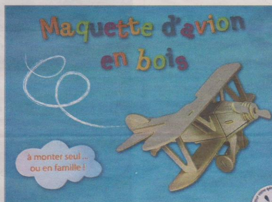
La maquette facile à faire, dès le plus jeune âge