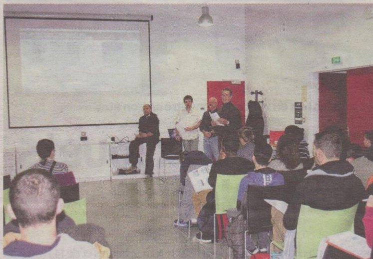
Les hectopascals au menu du premier cours.

« Du chaudronnier, au mécanicien en passant par l'hôtesse de l'air