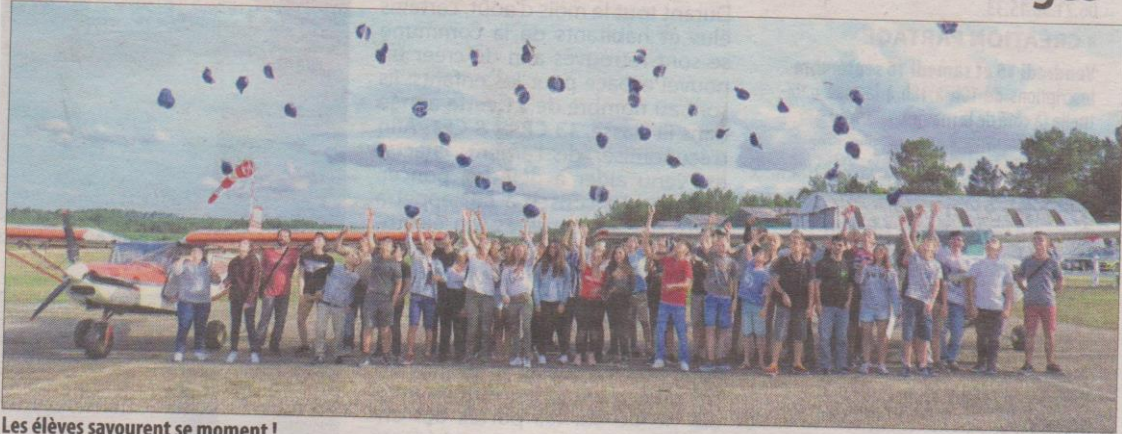
Les élèves savourent se moment !

Un peu plus de quatre-vingts candidats ont reçu leur Brevet d'initiation à l'aéronautique samedi dernier à l'aéroclub Montendre-Marcillac.