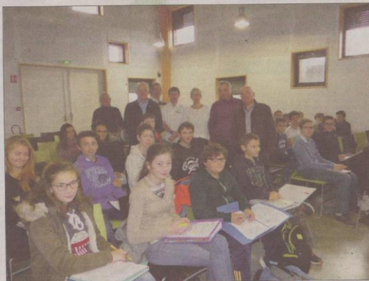
Le nombre de candidats oblige les instructeurs à couper la classe en deux sessions.

Les instructeurs, les élus locaux et les dirigeants de l'aéroclub se sont tous déclarés ravis du succès grandissant de l'intérêt porté par les enfants, au domaine aéronautique et sont tous prêts afin de prodiguer les cours théoriques, en cinq modules,