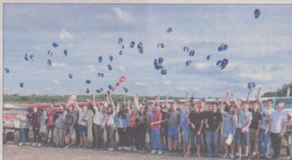
Le lancé de casquettes des jeunes diplômés, devenu maintenant tradition

Sur 100 candidats présents le jour de l'examen du mois de mai dernier, 84 ont été reçus et sont venus chercher leur diplôme, samedi 2 septembre, au club house de l'aéroclub