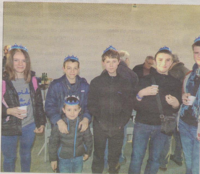
Moment de partage à la fin du cours