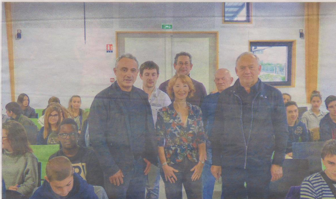
La salle de classe de la première session était pleine, pour la plus grande satisfaction des élus et dirigeants de l'aéroclub