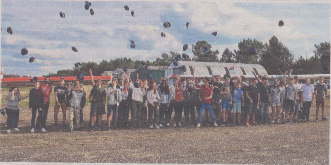
La joie lors de la remise des Brevets d'initiation aéronautique.

Samedi dernier, beaucoup de monde s'est déplacé à l'aérodrome de Marcillac pour la remise du Brevet d'initiation aéronautique. Un BIA qui, avec 53 candidats en 2015, 87 en 2016, et 100 cette année, connaît un succès grandissant auprès des collégiens de Haute Gironde et de la Charente-Maritime voisine.