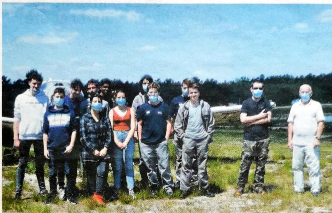
Les instructeurs avec leurs stagiaires. P.R.