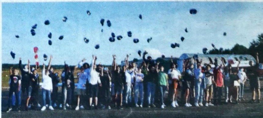
Le traditionnel jet de casquettes pour les diplômés du BIA.