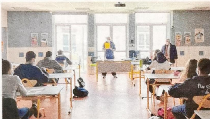
Les collégiens réunis pour passer l'examen, le 19 mai à Montendre.

Dix-neuf collégiens ont passé l'examen du Brevet d'initiation aéronautique le 19 mai au collège de Montendre. Résultats attendus d'ici quinze jours.