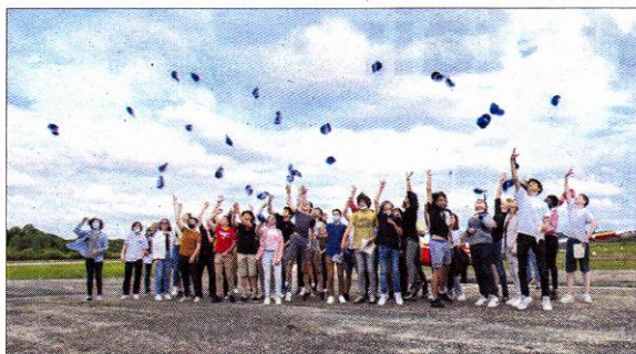
Aujourd'hui, ils font voler les casquettes, demain ce seront peut-être eux-mêmes