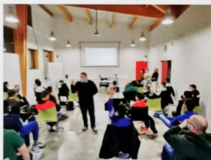
● Rentrée des élèves du BIA samedi 7 novembre au CFM à Reignac