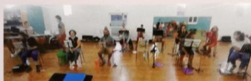
● Répétition distanciée pour les musiciens de l'EOM

Ainsi l'Ensemble Orchestral, après avoir repris ses répétitions dans la salle culturelle tout à fait adaptée au respect du protocole sanitaire, s'est vu à nouveau obligé d'arrêter ces temps collectifs. Mais aujourd'hui nos musiciens sont riches de nouvelles pratiques, ils ont expérimenté l'orchestre à distance. Chacun a pris soin de s'enregistrer à la maison, ce qui a permis de réaliser un clip que vous pouvez regarder sur https://bit.ly/35AXOXx .