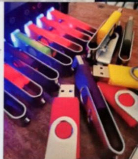
● Les clés USB, support de cours

Fort de 85,06% de réussite en Gironde à l'examen de septembre, et en ces temps compliqués, l'aéroclub Marcillac-Estuaire a dû redoubler d'efforts d'adaptation afin de garantir les mesures sanitaires indispensables au maintien de cet enseignement en plein reconfinement. Notre territoire bénéficie d'un grand tremplin pour les jeunes, le B.I.A. ouvrant maintes perspectives de formations dans les secteurs de l'aéronautique.