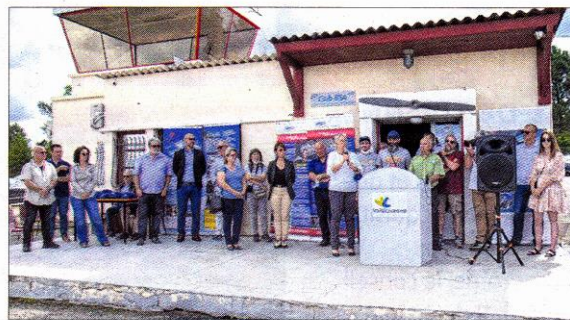
Élus, instructeurs, bénévoles, anciens élèves, tous réunis pour honorer les nouveaux diplômés