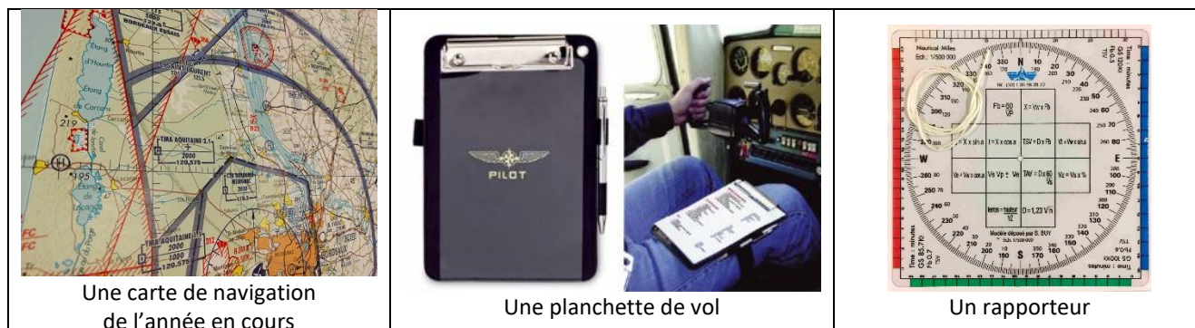
Une carte de navigation de l'année en cours